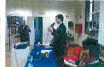
Elaborazione dell'associazione S.Lorenzo. Provincia di Susa

Aumentano i poveri, anche nei piccoli centri, e se da un lato si ritiene che il fenomeno sia legato a fattori strutturali, da un altro lato si teme che si tratti di un fenomeno che si sta aggravando. È quanto emerge da un'analisi che Confindustria ha commissionato all'Associazione S.Lorenzo, che ha analizzato le richieste di sussidio per il 2015. Il numero delle richieste è aumentato del 90 per cento, con un picco di 890 richieste nel 2015, contro le 500 del 2014. Le richieste sono aumentate in tutti i comuni, ma con un trend negativo per gli stranieri, che sono diminuiti del 10 per cento.