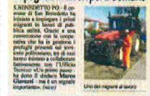
Uno dei progetti di lavoro

SAN BENEDETTO PO. È il comune di San Benedetto Po, in provincia di Cuneo, che ha dato il via a un progetto di inclusione sociale. I primi migranti sono stati assorbiti in lavori di manutenzione del verde pubblico, della pulizia delle strade e della manutenzione delle opere pubbliche. Il progetto è stato finanziato dal Comune e dalla Regione Piemonte. I primi migranti sono stati assorbiti in lavori di manutenzione del verde pubblico, della pulizia delle strade e della manutenzione delle opere pubbliche. Il progetto è stato finanziato dal Comune e dalla Regione Piemonte.