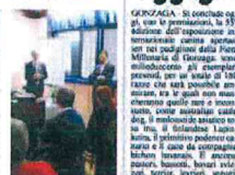
Elaborazione di S.Lorenzo

Da Mantova a Pegognaga, la banca (o il promotore finanziario) sono una controparte del cliente, che ricopre i ruoli di collocatore, produttore, depositario, gestore ed anche il soggetto che predispone ed adatta gli strumenti (officina finanziaria).