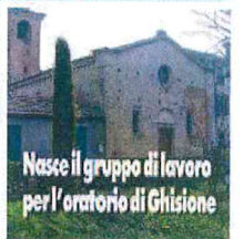
Oratorio di Ghisone a Villa Poma

Un gruppo di lavoro è stato costituito per la gestione dell'oratorio di Ghisone. Il gruppo è composto da volontari e da personale della parrocchia. Il gruppo di lavoro è stato costituito per la gestione dell'oratorio di Ghisone. Il gruppo è composto da volontari e da personale della parrocchia.